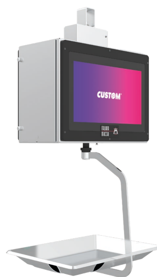
Vista lato cliente

Escluso palo di sostegno: da dimensionare in funzione dell'ambiente di lavoro